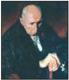
Portretul lui K.H. Zambaccian

Muzeul de Artă din Timișoara, deschis publicului la sfârșitul anului 2006, are printre cele mai valoroase exponate ale sale tablouri de excepție ale maestrului Corneliu Baba, adunate în colecția care-i poartă numele. Așa cum era de așteptat, Colecția Corneliu Baba este în acest moment punctul de atracție al Muzeului de Artă, timișoreni ori turiști aflați în trecere prin oraș găsind timp pentru a vizita muzeul. În acest moment, pot fi văzute nouăzeci de tablouri ale faimosului pictor, dintre care 59 au fost donate Muzeului de soția lui Corneliu Baba, doamna Constanța Baba (curatorul colecției fiind doamna Maria Muscalu) iar alte 31 au fost împrumutate de la Muzeul Național de Artă din București. Directorul Muzeului, scriitorul Marcel Tolcea, a îngrijit în anul 2006, Anul Corneliu Baba (comunitatea academică a sărbători la anul 2006, la 18 noiembrie, 100 de ani de la nașterea artistului), apariția unui frumos Calendar ilustrat cu operele pictorului (cuprinzând și o microbio-grafei a acestuia). Calendarul a fost tipărit cu sprijinul