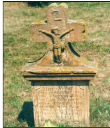
Piatra de mormant a primului svab inmormantat la Ortișoara

Nu neapărat. Dar a fost elaborat un proiect pentru asfaltarea unui drum care duce în sat. Este singurul drum care nu este asfaltat și asta dorim să facem anul acesta. Lucrare ne va costa în jur de 4,5 miliarde de lei