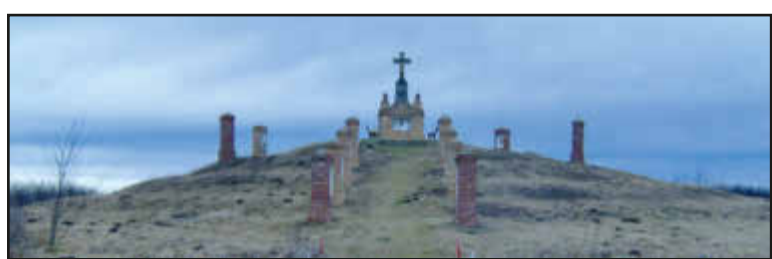
Kalvarienberg (Calvarul) -Biled, ianuarie 2007