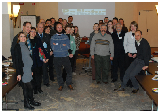
Echipa BeNatur la o sesiune de lucru în Ravenna (februarie 2012)