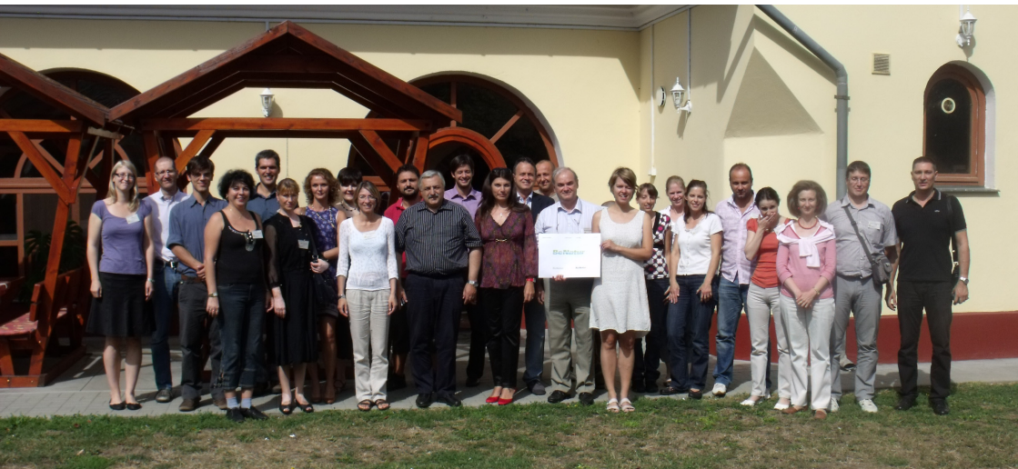
Membrii echipei BeNatur în timpul unei reuniuni de coordonare în Mezzotur (septembrie 2011)