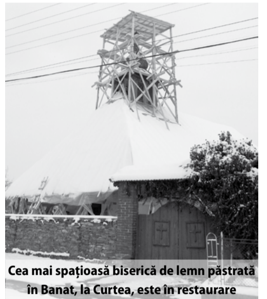
Cea mai spațioasă biserică de lemn păstrată în Banat, la Curtea, este în restaurare

În Curtea există și o biserică veche (ridicată în 1794 și pictată între 1804-1806), a cărei