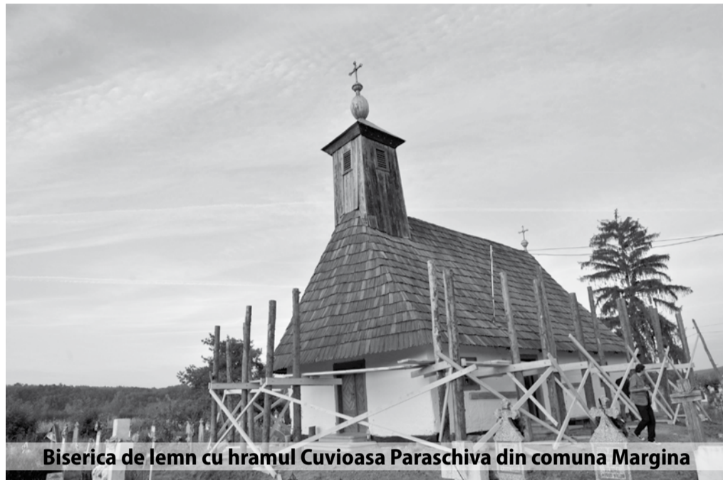
Biserica de lemn cu hramul Cuvioasa Paraschiva din comuna Margina

funcție de populație, ci în funcție de gradul de dispersie al comunei sau de numărul de localități sau kilometri de drumuri comunale sau alte criterii, cum ar fi lungimea rețelilor electrice sau a rețelei de apă. Din punctul acesta de vedere, populația fiind de doar 2.360 persoane, suntem comună de gradul 3, dar după întindere ar trebui să fim cel puțin de gradul 2, dacă nu de grad 1. Ni s-au repartizat ani de zile fonduri conform unei comune de gradul 3, iar acest lucru se regăsește în gradul de subdezvoltare al comunei. A doua particularitate mare a comunei a fost că, până în 2.000, am fost comună preponderent industrială. Aici erau peste 1.000 de locuri de muncă, acum nu mai este niciunul. Forța de muncă nu era doar din comună, ci și din localitățile învecinate. Lipsa locurilor de muncă se regăsește și în dezvoltarea comunei, în gradul de realizare a obiectivelor pe care le avem. Din total buget la nivel de an, doar 6 sau 7% sunt venituri proprii. Restul, 93-94%, sunt bani veniți de la bugetul de stat. Suntem o comună care depindem aproape în totalitate de bugetul de stat. Cam așa este în toată partea asta a județului, dar în proporția