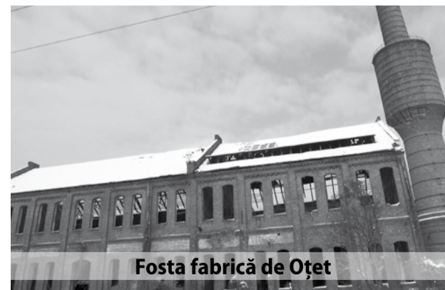
Fosta fabrică de Oțet

Până în 2010, populația din comuna Margina era pregătită pentru munca în industria chimică și a lemnului și mai puțin pentru agricultură. Zona nu e cea mai favorabilă pentru agricultură, dar producțiile erau destul de bune înainte de 1989. "După 2010 s-a desființat fabrica de oțet. Oamenii nu cred că s-au adaptat apoi, pentru a se apuca de agricultură. Scăderea populației s-a făcut pentru că cei care nu s-au adaptat s-au mutat la oraș. 10-20% din populație a plecat, tinerii au plecat, au rămas bătrânii. Plecând tinerii, bătrânii au decedat, au rămas casele lor și s-au vândut la prețuri mici, așa că le-au cumpărat familii din alte județe, tot oameni săraci. Pe aceștia trebuie să îi ajutăm, să le rezolvăm problemele. Ai noștri au plecat și au lăsat un gol, care s-a umplut cu probleme sociale. Locurile de muncă și agricultura ar putea schimba comuna, soluțiile de la nivel național se aplică și la noi. Ca inginer agronom, știu multe despre agricultură, avem soluri bune, și mai puțin bune, în general s-ar putea cultiva cam 50% din suprafața arabilă cu rezultate bune. Pe vremuri cultivam rapiță, orz și grâu, porumb, soia, floarea soarelui, sfeclă de zahăr, sfeclă furajeră și ceva legume. România nu poate să iasă din starea în care e, la fel ca și comuna Margina, decât cu locuri de muncă și