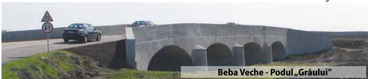
Beba Veche - Podul „Grâului”