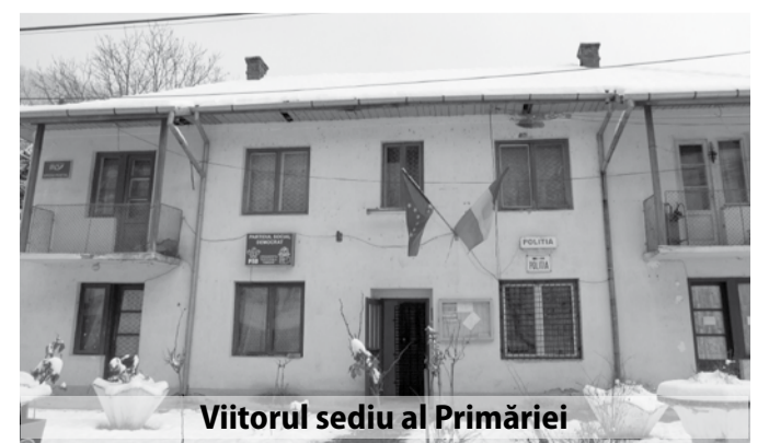
Viitorul sediu al Primăriei