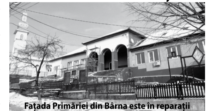
Fațada Primăriei din Bârna este în reparații

O situație regretabilă este în satul Pogănești, unde s-a construit, în urmă cu trei ani, o școală nouă, care acum, după comasarea școlilor, stă închisă. „La Pogănești funcționează doar grădinița. Mai avem două grădinițe care dacă nu vor avea copii până la toamnă va trebui să le închidem, la Drinova și Sărăzani. Școlarii sunt aduși acum la Bârna, a fost greu pentru că nu aveam spațiu suficient, o perioadă i-am transportat la Pogănești, ceilalți erau la Bârna, până am rezolvat. E păcat, am investit foarte