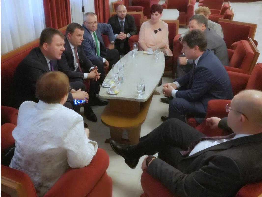
Discuție între președinții Euroregiunii DKMT

În acest an s-au împlinit 20 de ani de la semnarea protocolului de cooperare al Cooperării Regionale DKMT care a fost sărbătorit în data de 21 noiembrie la Novi Sad, Serbia.