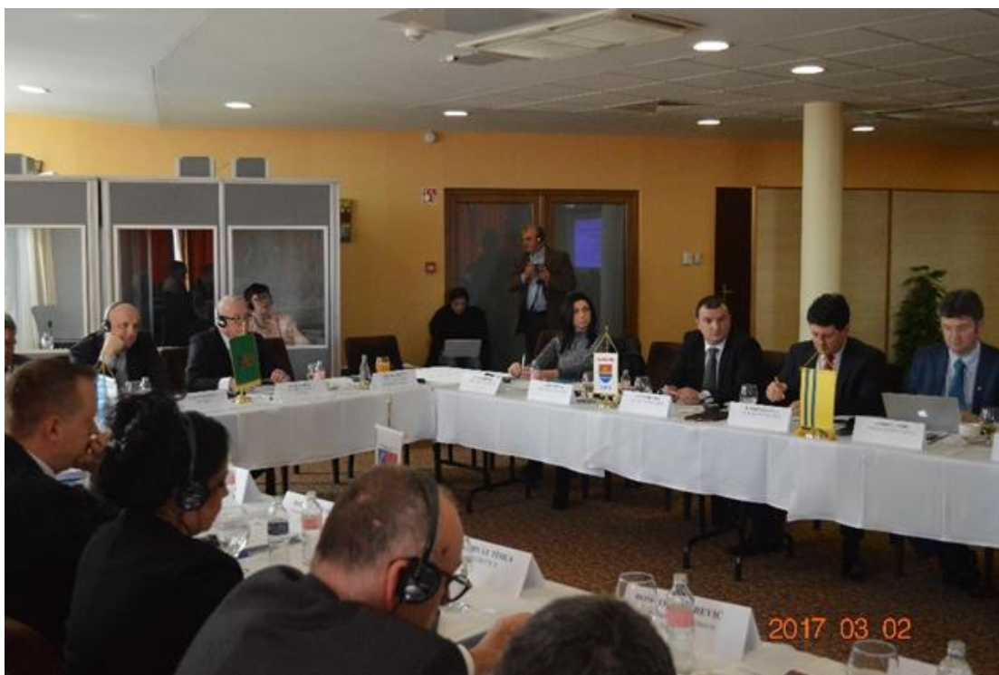
Ședința Adunării Generale a Cooperării Regionale DKMT din 2 martie 2017, Mórahalom, Ungaria

În anul 2017 au avut loc câte trei Adunări Generale ale Asociațiilor Agenției de Dezvoltare Euroregională DKMT Dunăre-Criș-Mureș-Tisa SRL Nonprofit de Utilitate Publică, respectiv Adunări Generale ale Cooperării Regionale DKMT (2 martie, 27 mai și 21 noiembrie).