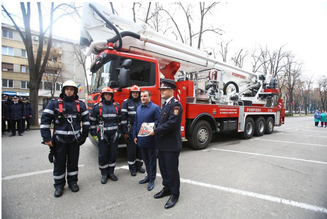
Ceremonia de predare-primire a autospecialei de salvare și intervenție de la înălțime (70 m), achiziționată din bugetul Consiliului Județean Timiș pentru Inspectoratul pentru Situații de Urgență "Banat".

De asemenea, s-au realizat 95 de achiziții directe, în valoare totală de 2315414 lei.