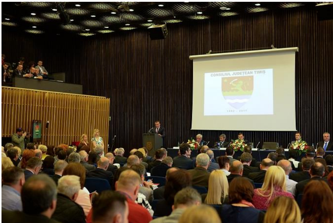
Consiliul Județean Timiș – 25 de ani în slujba comunității

Unul dintre momentele festive ale anului, a avut loc în data de 10 aprilie 2017, atunci când instituția Consiliului Județean Timiș a sărbătorit 25 de ani de la înființare. Evenimentul s-a bucurat de participarea a numeroși invitați din România și străinătate, care au ținut să felicite instituția noastră pentru activitatea de un sfert de veac.