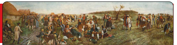
Faimoasa lucrare Die Einwanderung der Schwaben ins Banat - Emigrarea șvabilor în Banat