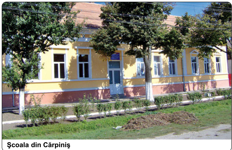
Școala din Cărpiniș