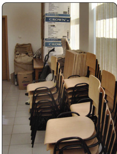
Mobilierul Punctului muzeistic se află în conservare la sediul Primăriei Uivar