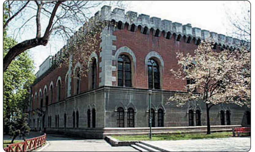
Contractul pentru consolidarea sediului Muzeului Banatului - Castelul Huniade a fost semnat la 1 septembrie 2006

- Modernizare Spital Clinic Județean de Urgență - buget CJT