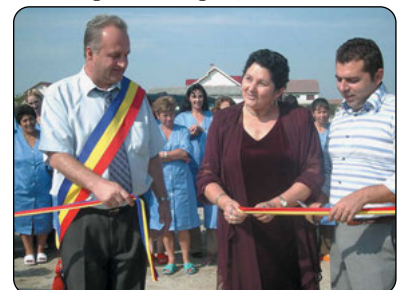
Deschidere de fabrică în Săcălaz - 2006

- Sediul Bibliotecă Județeană, Teatrul pentru Copii și tineri Merlin