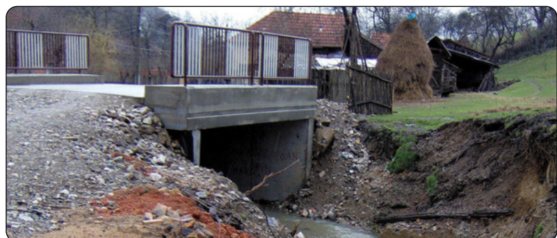
Refacere podet pe DC 114 la Balșești - 2006