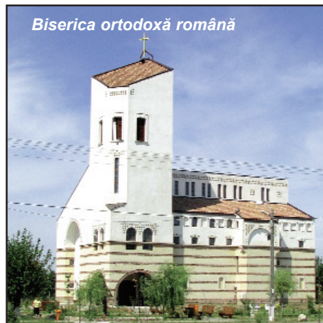
Biserica ortodoxă română