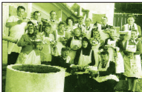
Concurs de preparare a prăjiturilor - Fibiș, 1967

Pe teritoriul de azi al Fibișului au fost descoperite vestigii încă din timpuri străvechi. Așa este cazul unui topor de cupru din epoca bronzului, apoi valul roman ale cărui urme pot fi găsite în mai multe puncte ale așezării, cum ar fi Maghiarod Pusta, Valea Borduș sau Răchiți, ultimul aflat la aproximativ 50-100 metri NV de localitate. Către așezarea învecinată Seceani se află ruinele unei mănăstiri („Mănăstirea de lângă Apa Neagră”), posibil mănăstire ortodoxă întemeiată în secolele XVI-XVII.