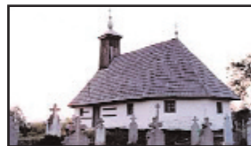
2. Biserica din Coșevița