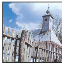
4. Biserica din Bulza