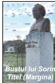
Bustul lui Sorin Titel (Margina)

Considerat de critici drept cel mai mare prozator al Banatului, scriitorul Sorin Titel (eseist și dramaturg, în egală măsură) s-a născut în comuna Margina la 7 decembrie 1935. A absolvit Facultatea de Filologie din București. Profesor de limba română, apoi redactor la revista timișoreană „Orizont”, după care devine redactor la revista „România literară”. A fost membru al Uniunii Scriitorilor din România. Debutează cu volumul de povestiri „Copacul” (1963). Publică volume de povestiri, eseuri, nuvele („Noaptea inocenților”; „Reîntoarcerea posibilă”), romane („Țara îndepărtată”; „Pasărea și umbra”; „Clipa cea repede”; „Femeie, iată fiul tău”; „Melancolie”), teatru („Bucătăria de vară”, 1998). Este tradus în limbile maghiară, germană și franceză. A obținut premii literare importante: Premiul revistei „Orizont” (1968), Premiul Uniunii Scriitorilor din România (1971, 1974, 1977, 1985), Premiul „Ion Creangă” (1985). A trecut la cele veșnice la 17.01. 1985.