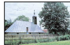
3. Biserica din Nemeșești