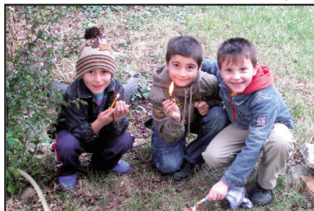
Trei „licurici” în curtea bisericii ortodoxe române - Pădureni, octombrie 2009

Persida Rugu a debutat ca poetă în anul 1983 în revista timișoreană „Orizont”. Este membră a U. S. R., filiala Cluj-Napoca. Publică volumele „ Descultă în iubire ”, 1990; „ Faraonul albastru ”, 1993; „ Cartea cu aburi ”, 2000; „ Pași în iarba ninsă ”, 2000; „ Scriitori din singurătate ”, 2001; „ Un pahar de lumină ”, 2004; „ Poeți clujeni contemporani ”, 2005; „ Peregrini prin timp ”, 2006; „ Viața după Azelman ” (ed. a III-a), 2010.