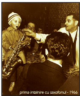
prima întâlnire cu saxofonul - 1966

Participă la festivaluri naționale și internaționale de folclor, efectuează numeroase turnee artistice de succes în Franța, Elveția, Serbia, Germania, Canada și SUA, ca solist instrumentist la clarinet, taragot, saxofon, fluiet, ocarină, caval (începând cu anul 1982).