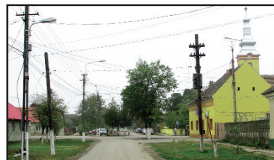
„ Ulița grecilor ” - acolo unde locuiește și azi familia Caragea...

Comuna Pădureni este printre puținele localități din județul Timiș a căror populație își are originea în îmbinarea dintre băștinașii români și cuceritorii otomani ai Banatului din secolele XVI-XVII. Astfel, la sfârșitul dominației otomane, în Lighed (numele medieval al așezării Pădureni), elemente de populație română și otomană au pus bazele unei noi așezări în Lunca Timișului. Sunt nume turcești de familie din Pădureni pe care le întâlnești și azi: Bechir, Derviș, Lengher, Seiman sau Turcan, tot așa cum islazul comunei se numește Ali bei ori alte locuri din arealul satului, cum ar fi Vadu' Turcului și Câmpu' Tătarului. Românizarea (și creștinarea) turcilor din Lighed s-a produs, se pare, repede, astfel că la sfârșitul secolului al XVIII-lea documentele austriece vorbesc despre o comună valahă, cu