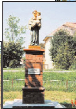
Statuia Sfântului Anton - Orțișoara