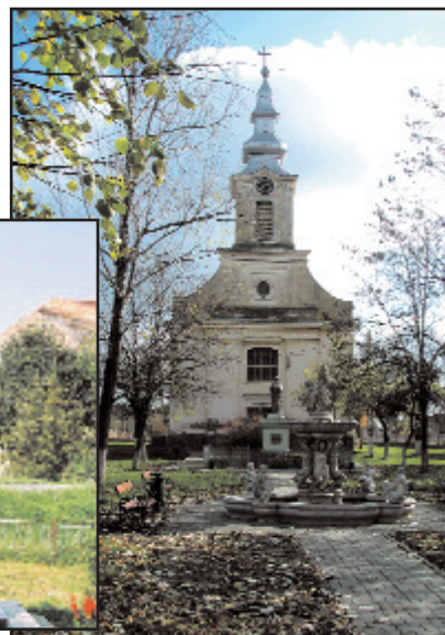
Biserica romano-catolică din Orțișoara