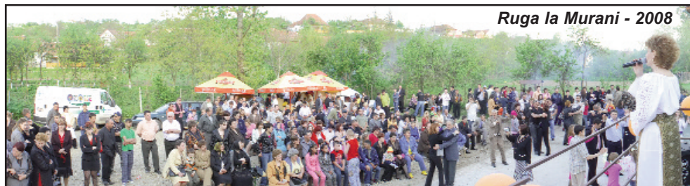
Ruga la Murani - 2008