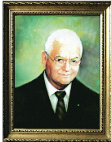
Portretul academicianului, realizat de maestrul Vasile Pinteș