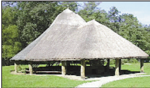
Moara cu cai din Sânpetru, reconstruită la Sibiu

În lunile iulie-august 1977, Muzeul Civilizației Populare Tradiționale „ASTRA” - muzeu etnografic în aer liber - a trimis o echipă de cercetători în județul Timiș pentru depistarea unei mori cu cai și pentru a obține informații necesare reconstrucției acesteia.