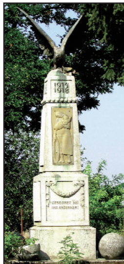
Monumentul de la cimitir