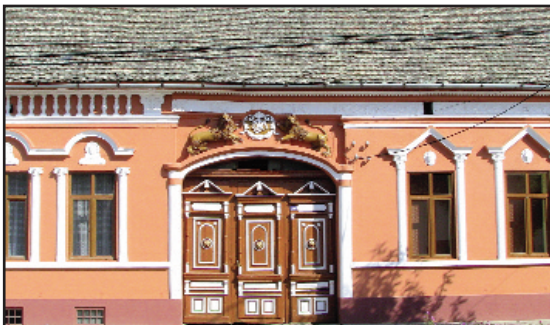
Casa cu lei