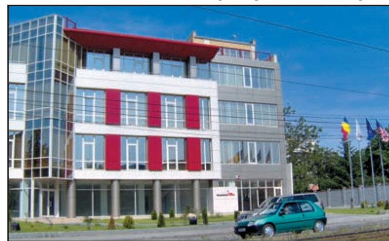
Sediul din Timișoara al holdingului Smithfield Ferme