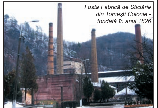
Fosta Fabrică de Sticlărie din Tomești Colonie - fondată în anul 1826