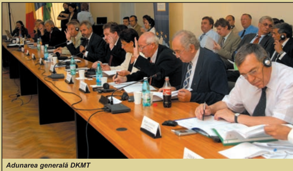
Adunarea generală DKMT

Și vicepreședintele Consiliului Executiv al Provinciiei Autonome Voivodina, Tihomir Simic, s-a referit la aderarea Serbiei la Uniunea Europeană și al sprijinul oferit de România și Ungaria, dar și la importanța cooperării euroregionale. „În Uniunea Europeană, granițele tind să dispară,