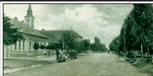
Fotodocument - Banlocul la anul 1906. În stânga se vede turla bisericii ortodoxe române