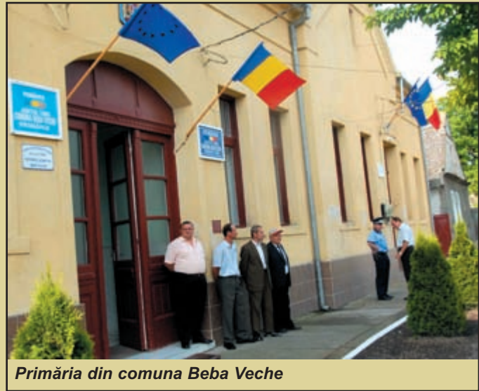
Primăria din comuna Beba Veche

În zilele de 2 și 3 iunie a avut loc cea de a noua întâlnire a Euroregiunii Dunăre-Criș-Mureș-Tisa, parteneriat transfronta-