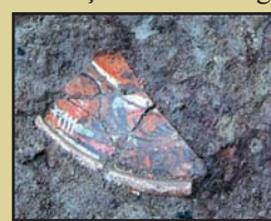
Fragment de farfurie turcească

În urma săpăturilor arheologice din exteriorul incintei s-a tras concluzia că suprafața castelului angevin a fost mai restrânsă, urmele acestuia putând fi surprinse doar în curtea interioară și în spațiile interioare ale clădirii.