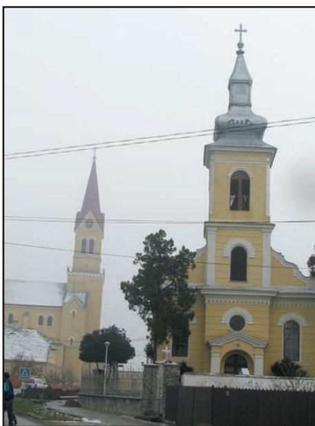
Vedere din Cenad- decembrie 2007

N.C. - Deocamdată, nu mi-am terminat mandatul.