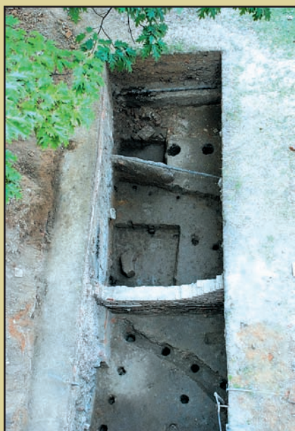
Sistemul de fortificație al castelului (secțiunea II)