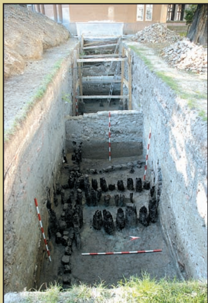
Sistemul de fortificație al castelului (secțiunea I)