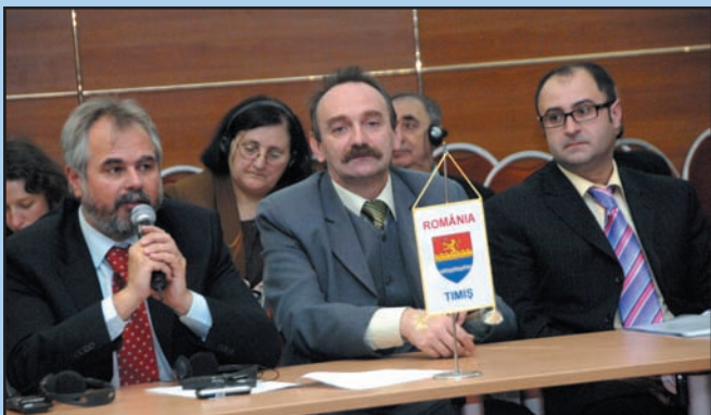
Adunării Generale Csongrad.