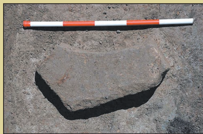
Fragment de ancadrament gotic

În data de 5 decembrie 2007, în Sala Mare a Palatului Administrativ a avut loc festivitatea de decernare a premiilor Pro Cultura Timisiensis 2007 - seniori .