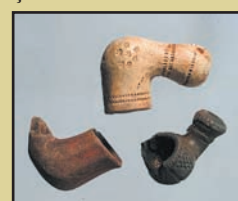
Pipe de epocă turcească

Pe baza cercetărilor am putut observa și principiile de construcție ale clădirii castelului. Astfel, în solul mlăștinos s-au bătut pari de lemn (probabil stejar), peste care s-au așezat scânduri. Pe această structură s-a construit apoi fundația propriu-zisă de cărămidă. Această tehnică de construcție a fost aplicată și în cazul construcțiilor din zonele mlăștinoase ale Ungariei, dar și în Italia. Prezența meșterilor italieni este consemnată documentar și în cazul șantierului de construcție a reședinței regale și probabil au fost chemați și de comitele Scolari, el însuși italian la origine.