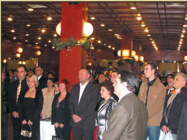
Se intonează Imnul României