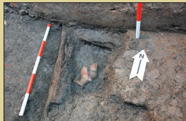
Ulcior de sec. XIV-XV