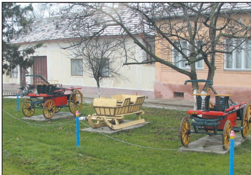
Muzeu în aer liber

R. - Unii localnici, cei de peste 62 de ani, au vândut pământul pentru renta viageră.