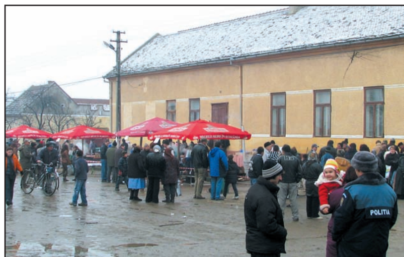
Ziua Națională a României sărbătorită în fața Căminului Cultural

R. - Când veți termina mandatul actual, veți sta să judecați cum va fi mai bine să faceți?