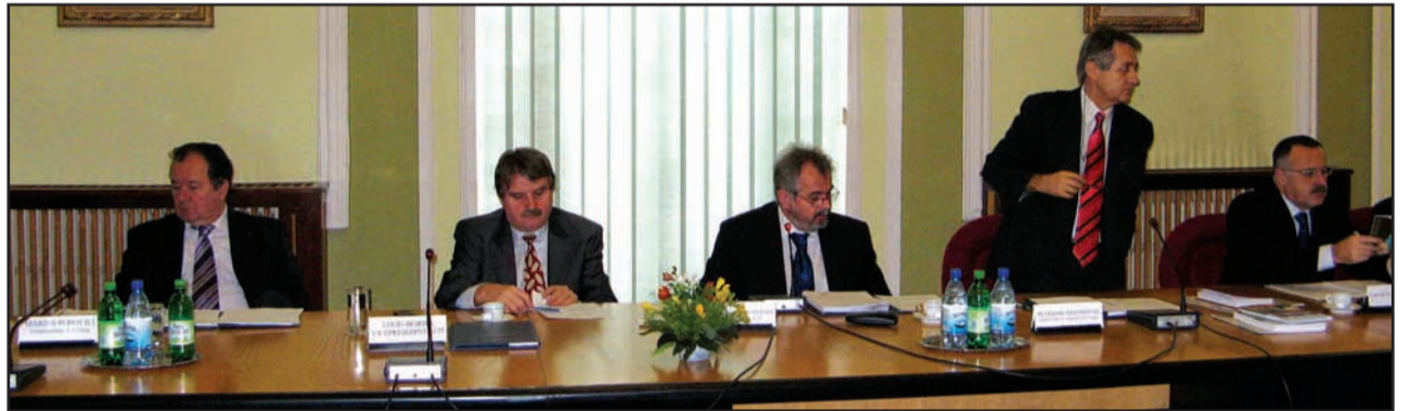
Sinersig comuna Boldur, județul Timiș

Hotărârea privind aprobarea unificării unor parcele de teren din imobilul situat în satul