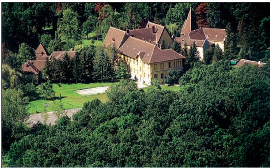
Liceul Silvic (vedere de sus)

Echipa Comisiei de sănătate și protecție socială, împreună cu ADETIM și DGASPC Timiș, a participat la proiectul de multiplicare al modelului francez, de construire a caselor pentru tinerii care depășesc vârsta de 18 ani, în care să locuiască până se încadrează în muncă. În acest context au fost contactate primăriile din Jimbolia, Făget și Sănnicolaul Mare pentru găsierea unor soluții specifice