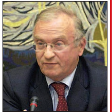
Luc Van den Brande

Constantin Ostaficiuc este din 1 ianuarie 2007 și președintele Delegației României la Comitetul Regiunilor. CoR este consultat de Comisia Europeană și Consiliul Europei în acele probleme care au efect la nivel local și regional și care se referă la următoarele domenii: coeziune economică și socială, rețeaua de infrastructură trans-europeană, sănătate, educație, cultură, politica pieței muncii, politică socială, mediu, pregătire profesională și transporturi.