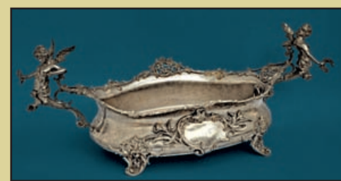
Fructieră, stil neorococo, argint 800%, turnat, cizelat, ciocănit, gravat

Din a doua jumătate a secolului XIX până în perioada interbelică, producția locală de obiecte din metal se caracterizează prin asimilarea și interpretarea curentelor artistice occidentale, de la Biedermeier și neostil-