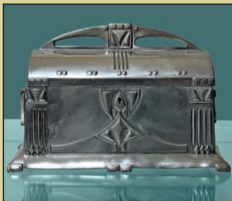
Casetă pentru bijuterii, Jugenstil, perioada interbelică, alpaca argintată, cizelată

secolul XVIII de Francesco Grisellini, în monografia Încercare de istorie politică și