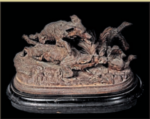
Statuetă, Atelierul de topitorie artistică al Societății de Căi Ferate Anina, cca 1877, fier turnat, cizelat, postament de lemn

Activitatea autohtonă de prelucrare a metalelor este consemnată documentar în