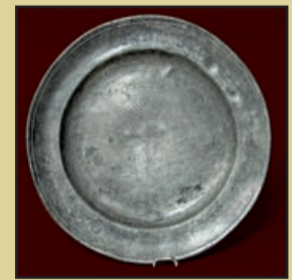
Farfurie, stilul renașterii florale transilvănene, Atelier brașovean, 1819, cositor, incizat, gravat

În aceeași perioadă, proiectele de sistematizare a orașului Timișoara, însoțite de un amplu program edilitar, au determinat evoluția spectaculoasă a tehnicii vitraliilor și a feroneriei artistice. Artizanii fierului forjat