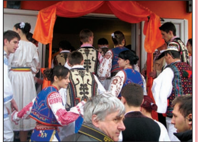
Artiștii se pregătesc să urce pe bină