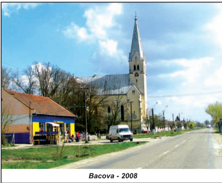
Bacova - 2008

venit diverși indivizi cu oile, au mai dat foc, s-au furat aracii, dar încet-încet și-au refăcut proprietățile, rămânând cam 300 de hectare ale Agenției Domeniului Statului. Au intervenit iarăși niște investitori care, fie că au cumpărat investiția IAS-ului și, automat, au început să folosească terenul, fie că au luat de la ADS în concesiune teren. Important este ca în doi-trei ani viile din Buziaș să revină, să producă ceea