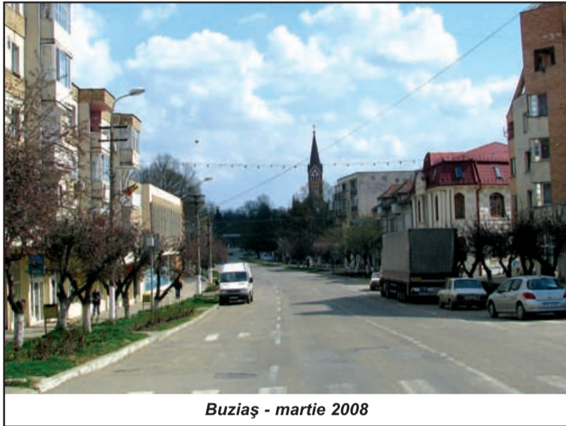
Buziaș - martie 2008

Legiitorul a greșit, după părerea mea, atunci când a decis să ia din impozitele care vin la buget. Și așa localitățile mici, în general, trăiesc din aceste impozite. Adică, toată lumea plătește, și acasă investim, dar nu ni se permite pe această bază scăderea impozitului datorat bugetului local, așa cum se întâmplă cu aceste societăți comerciale. Dar, în fine, s-a cerut acest lucru conform codului fiscal atribuit. Numai că reprezentanții societății nu au putut prezenta Consiliului Local o situație clară a lucrărilor pentru a promova un proiect de hotărâre. Anumite obligații firești în asemenea solicitări nu au fost îndeplinite. Adică, acei reprezentanți ai societății nu au înțeles multă vreme că trebuie să