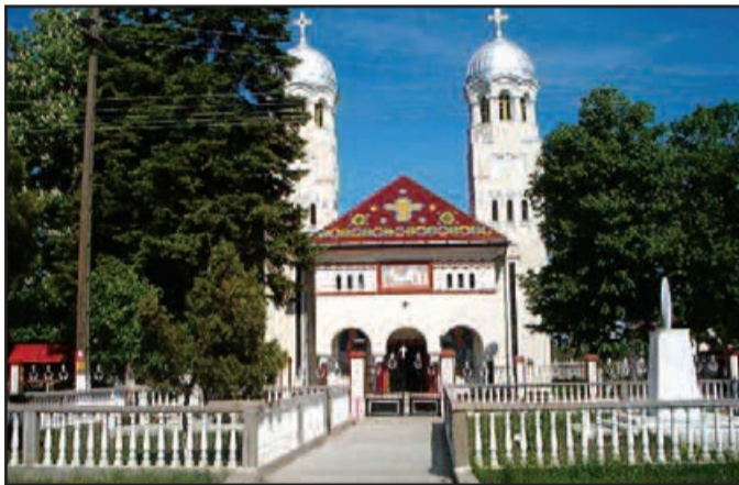
Biserica Ortodoxa din Ghiroda

În ziua de 9 decembrie 2007 la manifestarea „Cântecele Betleemului“, ediția întâi, ținută în parohia Timișoara Cetate, corul mixt al parohiei noastre ocupa locul întâi.