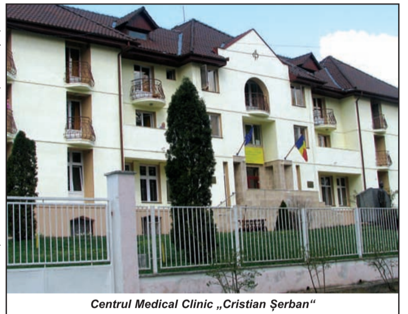
Centrul Medical Clinic „Cristian Șerban”

A.I: Eu am văzut doar o nepoată de-a lor, o