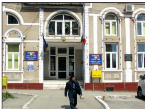
Hotărârile C.J. Timiș nr. 2/2008 și respectiv nr. 8/2008: