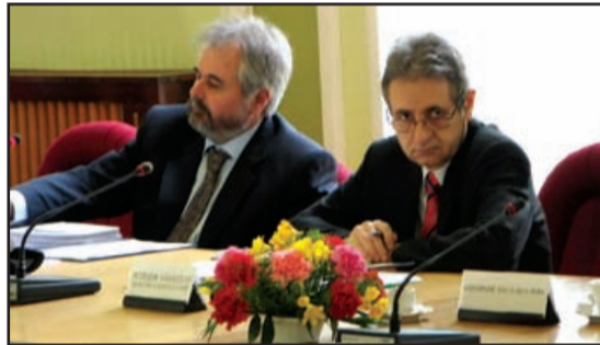
Public Comunitar de Evidență a Persoanelor Periam

13) Proiect de hotărâre privind darea în folosință gratuită a unor spații din Palatul Administrativ