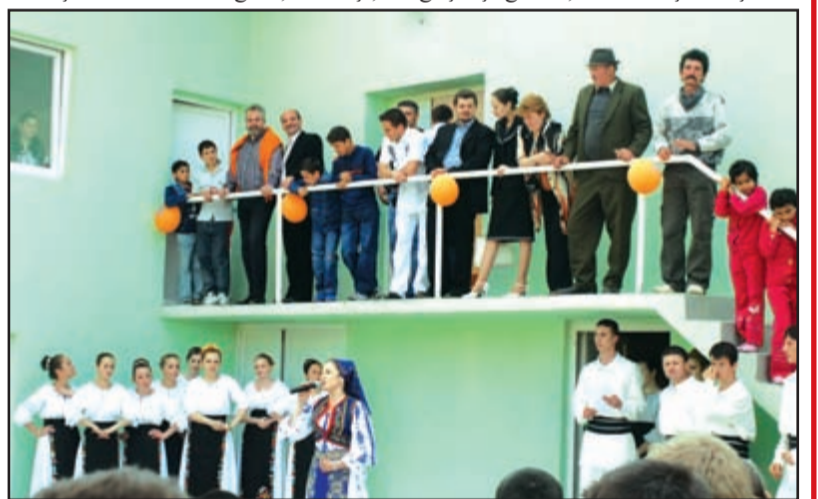
Ruga la Murani, 28 aprilie 2008 - Ansamblul Hora Pișchiei

Oaspete de seamă a fost președintele Consiliului Județean Timiș, Constantin Ostaficiuc, care a povestit murănenților că se simte ca un fiu al satului prin alianță, bunul soției sale, în v a ț a t o r u l