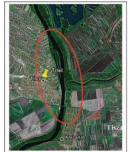
Locația exercițiului pentru inundații DKMT RESCUE 45°12'41.77" Nord 20°17'53.34" Est

tatea de aplicare a acordării ajutorului internațional și prevederile Directivei și a Metodologiei INSARAG. Odată cu exercițiul pe teren organizatorii exercițiului au furnizat OSOCC presupuneri și simulații care se desfășoară în timp real.