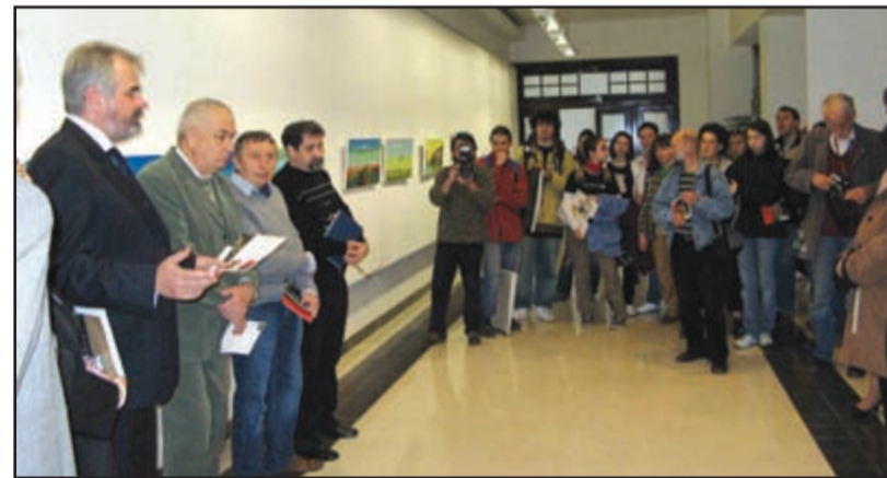
17 aprilie 2008- Palatul Administrativ, simezele etajului II - vernisajul expoziției “Plein Air” a maestrului Constantin Răducan

C.O. -Aici este o mică problemă, având în vedere faptul că e vorba de comuna Dumbrăvița, unde alesul local este un primar cu un orgoliu deosebit iar comunitatea din localitate a prosperat formidabil datorită unor condiții particulare, să le zicem „rezidențiale”. Avem o