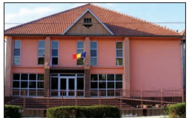
Casa de Cultură din Recaş