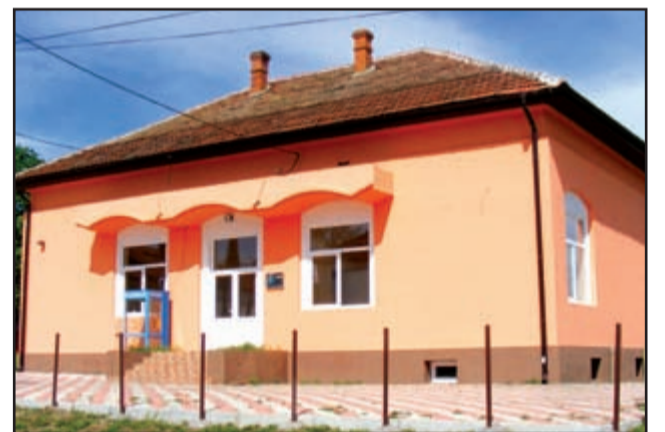
Căminul Cultural din Petrovaselo

R. - Recaşul e oraș. Are are serviciu de