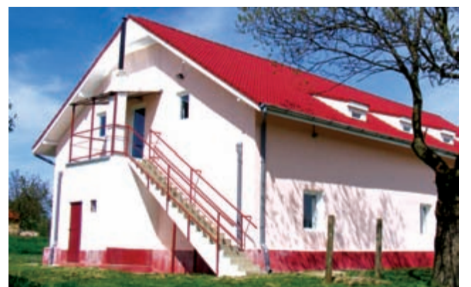
Căminul Cultural din Herneacova