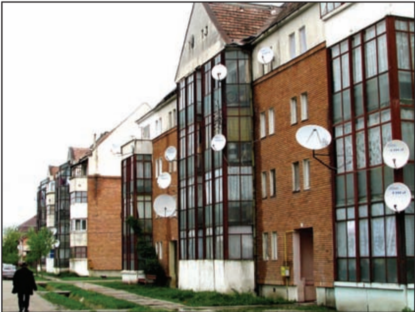
Recaș - cartier de blocuri

M.P. - Colaborarea între Primărie și Poliția Recaş este foarte bună. Sigur că și ei, ca personal, sunt mult mai puțini decât ar trebui. Recaşul are încă șase sate aparținătoare: