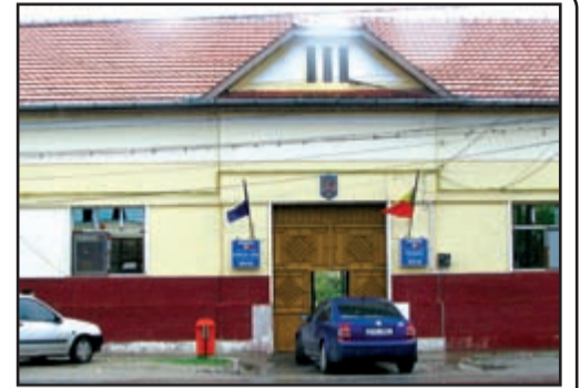
Izvin, Herneacova, Petrovaselo și Stanciova.