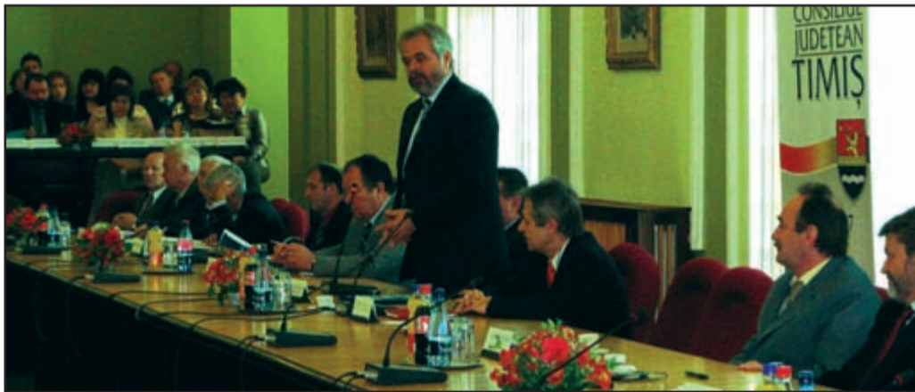
Plenul Consiliului la 15 ani de la înființarea instituției administrative a județului Timiș

C.O. - Prosper, în sensul că sunt un om din clasa de mijloc. Și, de fapt, pentru ce am militat dacă nu pentru normalitatea noastră finan-