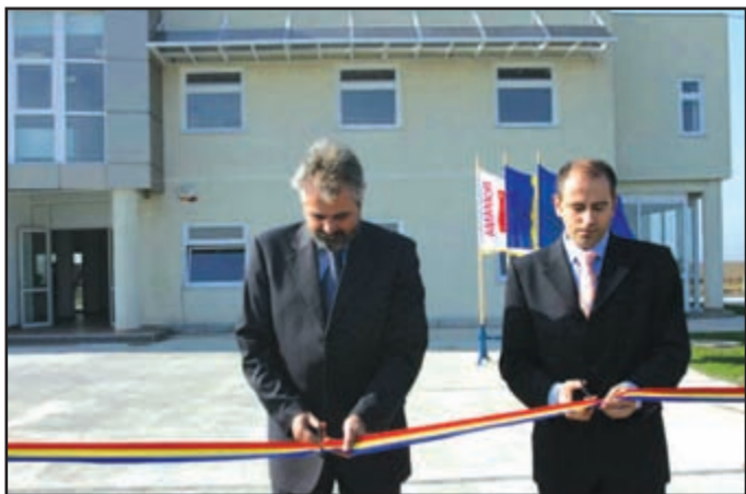
Inaugurarea uneia dintre investițiile importante ale județului Timiș: Parcul Industrial și Tehnologic

C.O. - Întotdeauna am susținut acest lucru! Competențele și valorile locale trebuie promovate. În cei patru ani ca președinte al Consiliului Județean Timiș am promovat această idee în toate domeniile. Am promovat-o în domeniul culturii, în domeniul sportului, am promovat-o în domeniul investițiilor, în domeniul științific, mai ales prin parteneriatele pe care le-am creat. Cred în valoarea și în forța timișenilor și a bănățenilor. Nici nu m-aș fi angrenat într-o astfel de muncă dacă n-aș fi avut în spate forța valorilor și a competențelor locale, ca o susținere la calitate mea de președinte al Consiliului Județean și ca reprezentant