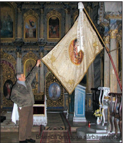
Biserica ortodoxă sârba, interior