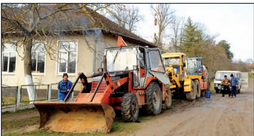
Lucrări de alimentare cu apă - 2009

Paradoxal, cei mai puțini localnici sunt în Hodoș, unde pe listele de alegători erau trecute doar șase persoane, ciobani. "La Hodoș avem o biserică unde nu s-au ținut slujbe din 1966, într-o vreme au stat și oile acolo în biserică.