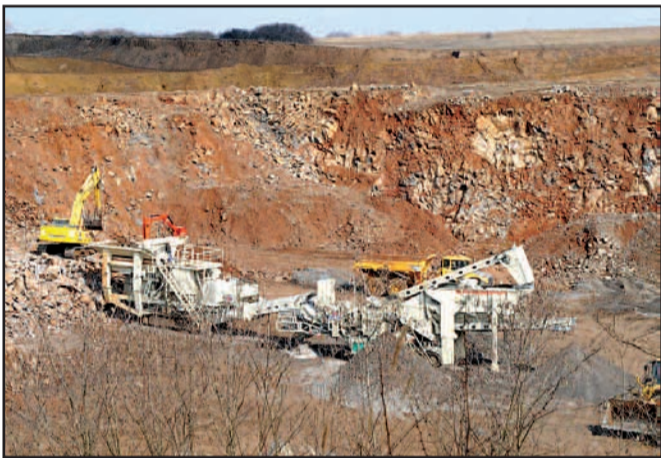
Cariera de piatră (bazalt) de la Lucareț