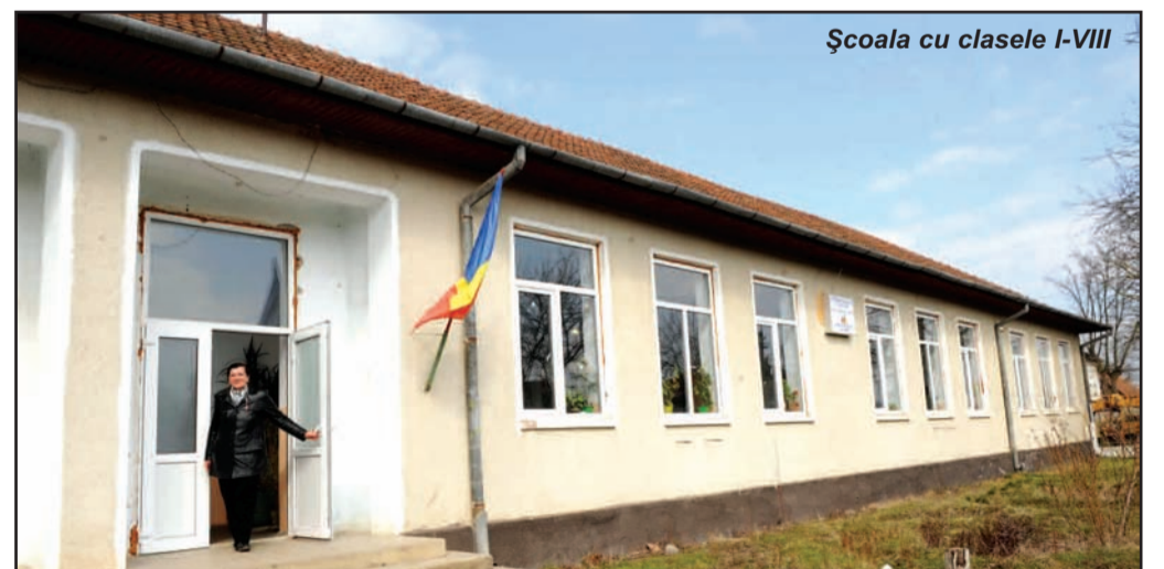
Școala cu clasele I-VIII

Primarul își amintește că se celebra și kirwei, la Teș, dar și acest obicei s-a sistat. Edilul vrea să re-