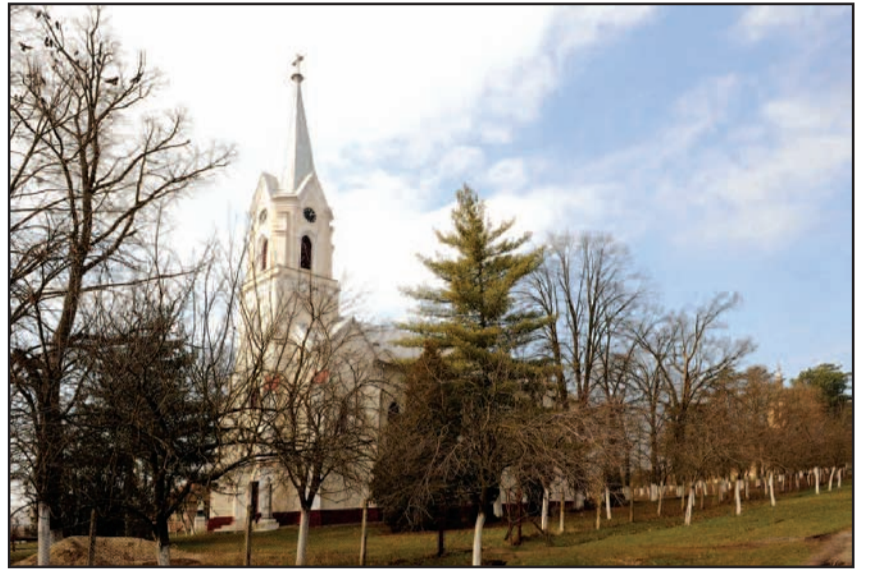
Biserica Ortodoxă din Brestovăț

ani nu s-a mai făcut nimic, pentru că satul a îmbătrânit. Sunt numai pensionari, iar copiii și nepoții vin numai de sărbători, pentru că stau la oraș. La școală mai facem muzică, dansuri populare. Începem sau terminăm ora cu cântece slovace, la orele de limbă slovacă. Mai puțin facem istorie, pentru că, deși sunt slovaci, ei nu cunosc limba maternă, deoarece în familie se vorbește românește. Au ore opționale de limbă slovacă, pentru cine vrea să se înscrie. Eu le predau cititul, scrisul și dezvoltarea vorbirii. Am avut și festival în limba pentru minorități, dar acum 7-8 ani și au venit din comunele unde sunt slovaci. La Nădlac și în Bihor sunt cei mai mulți slovaci. Sunt și la Iosifalău și Topolovăț. Nu se mai face festivalul, pentru că e problemă de fonduri, deși s-a mai pus problema. Eu merg anual la Nădlac să mă întâlnesc cu foștii colegi și am mai discutat despre asta. E un lucru frumos, dar trebuie organizare și bani".