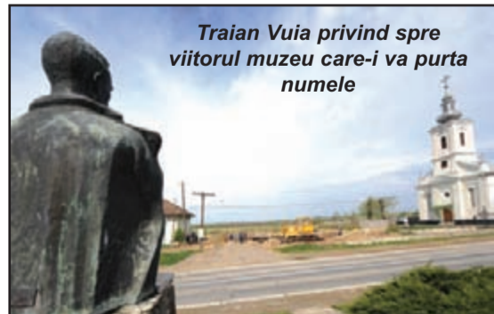
Traian Vuia privind spre viitorul muzeu care-i va purta numele