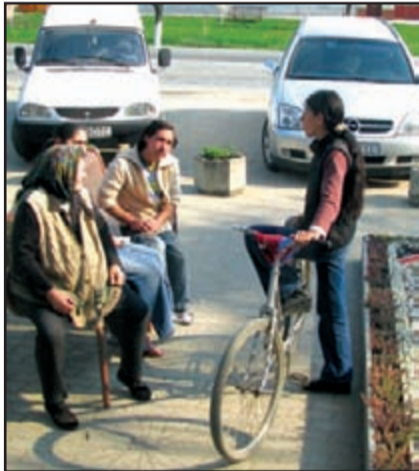
La givan, în fața primăriei

de euro pentru proiectul acesta comun. Vrem să achiziționăm două mașini compactoare de 18 mc fiecare, pentru colectarea gunoaielor. Acum avem serviciu de salubritate la Jebel. Cumpărăm două compactoare și câteva sute de europubele în toată regiunea din proiect. Se vor face niște platforme betonate, unde se va deversa gunoiul și se va sorta. La 16 iulie am ordin să închid groapa. Nu o să reușim să terminăm Eco-Ciacova până atunci, dar o să ducem gunoiul de la Jebel la Ciacova, pentru