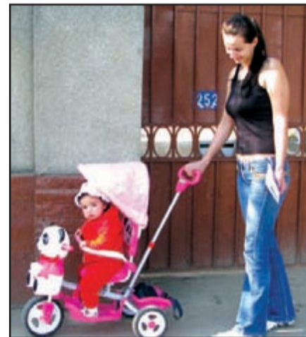
Noua generație din Jebel la "șpațir"

Primarul își ghidează, an de an, activitatea