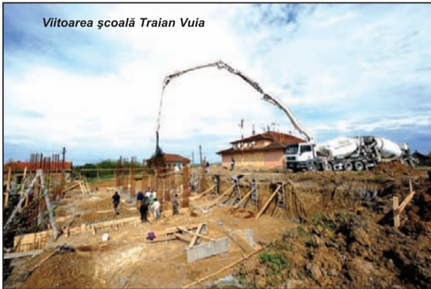
Viitoarea școală Traian Vuia

la Sudriaș. În plus, este și șoseaua națională la Traian Vuia. Suntem unicat în țară.