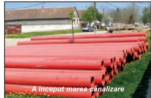
A început marea canalizare

- Ioan Munteanu: Am trimis proiect la București pentru asfaltarea tuturor drumurilor din comuna Liebling, pentru renovarea tuturor căminelor din satele Cerna, Iosif și Liebling, extinderea canalizării și pentru reabilitarea