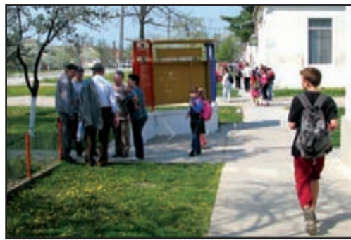
Un centru de comună animat

Am făcut un calcul să dau afară o parte din personal, dar nici dacă îi dau afară pe toți nu îmi acopăr deficitul. Bugetul este de 43 de miliarde de lei vechi, dar am trecut în plus sume la cheltuieli, pentru că nu vom încasa prea repede cei 4,4 miliarde deficit. Un miliard am