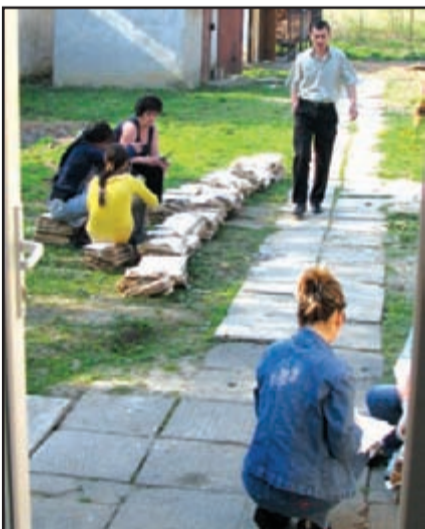
Arhiva Primăriei scoasă la aerisit...