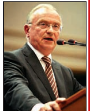
Luc van den Brande