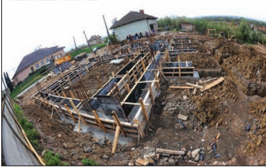
Viitorul Muzeu Traian Vuia

autostrăzi pe teritoriul comunei dumneavoastră?