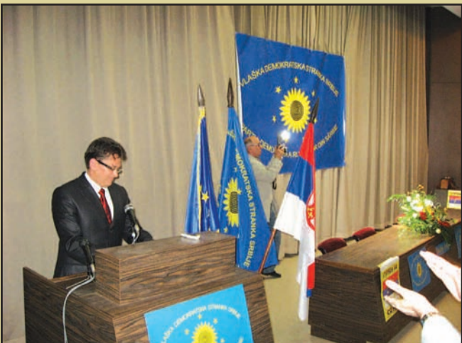
Predrag Balasevici, președintele Partidului Democrat al Românilor din Serbia