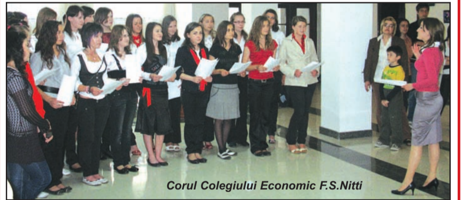
Corul Colegiului Economic F.S.Nitti

Expoziția a fost un succes în cadrul proiectului, fiind apreciată atât de reprezentanții Consiliului Județean Timiș, Prefecturii, cât și de cadrele didactice și seniori. Programul cultural-artistic a fost realizat de elevii Colegiului Economic F.S.Nitti, care au prezentat cântece și un dans artistic sportiv.