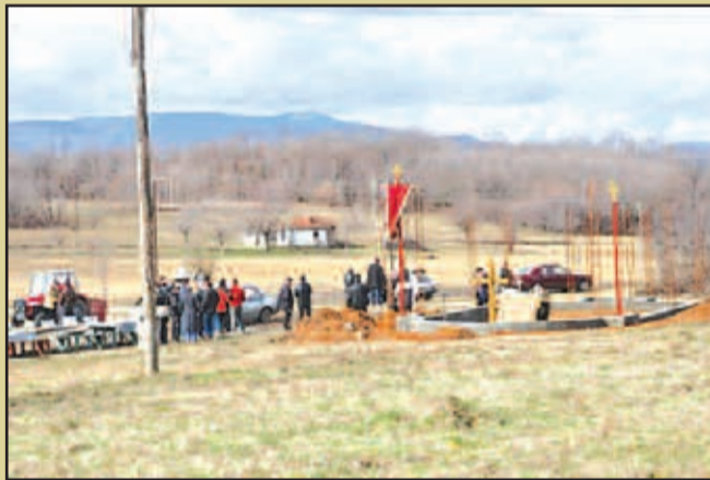
Fundația Bisericii Sfântului Niceta din Mălainița