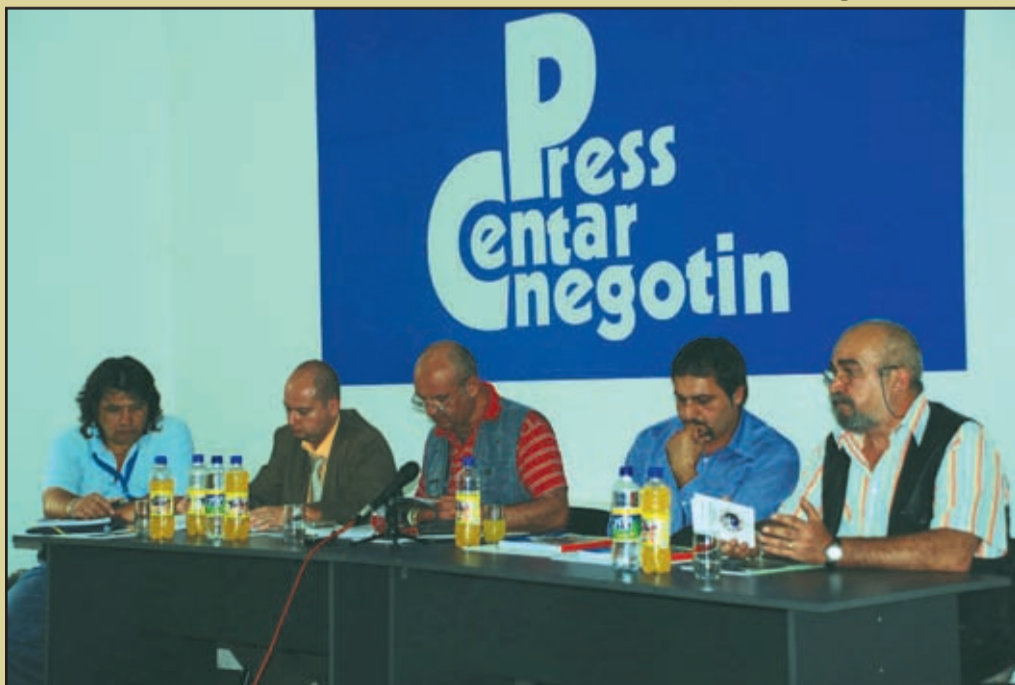
Lansarea cărții la Negotin

Detalii pe internet: www.pentruromani.ro , www.protopopiatuldaciaripensis.rs , www.timocpress.info