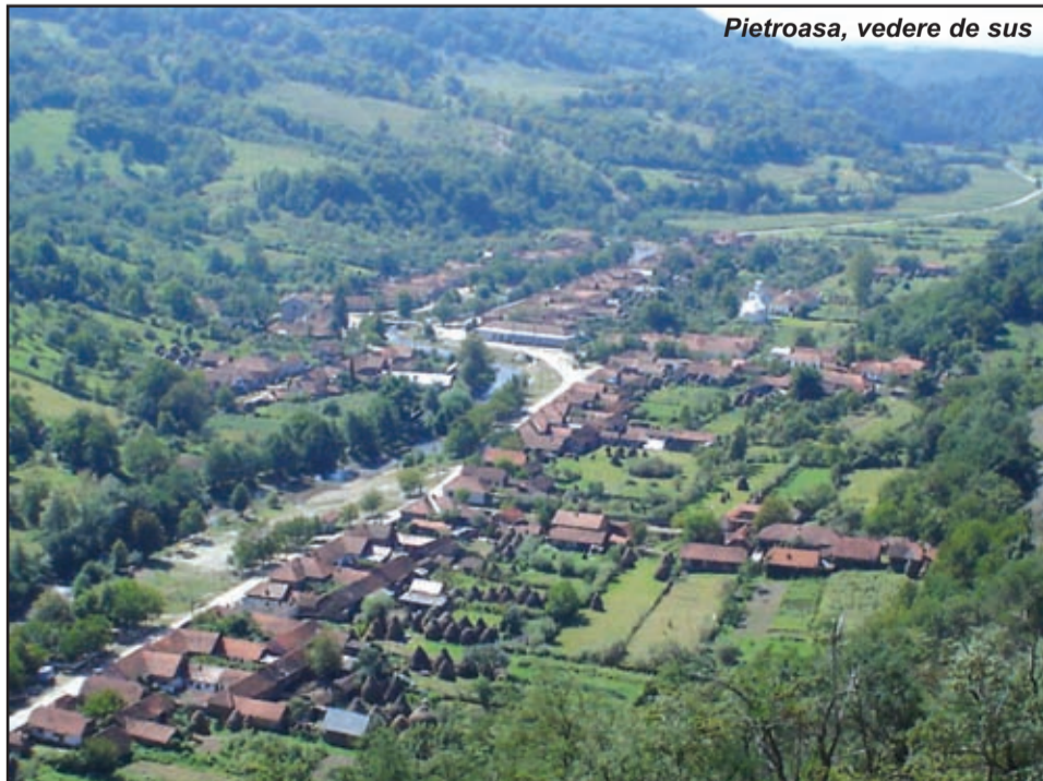
Pietroasa, vedere de sus

consolidare a malurilor râului Bega și de regularizare a albiei în localitatea Pietroasa; Terminarea lucrărilor la Dispensarul medical Pietroasa și dotarea lui cu tot ceea ce este necesar; Realizarea unui sistem de canalizare prin amplasarea în fiecare sat a unor instalații de epurare; Finalizarea lucrărilor la alimentarea cu apă a satului Fărășești; Găsirea unor soluții viabile pentru construirea unei săli de sport și al amenajării unui teren de fotbal; Lucrări de curățire în pășunea comunală; Aplicarea unei îmbrăcăminți asfaltice pe o distanță de 2 km pe drumul județean în intravilanul și extravilanul localității Pietroasa; Amplasarea unei antene în zonă pentru amplificarea semnalului pentru telefonie mobilă; Extinderea intravilanului localităților prin realizarea P.U.G-urilor și a unui P.U.Z. în locul numit CHEIA în scopul promovării agroturismului în zonă; Restaurarea Bisericii Ortodoxe, monument istoric, din satul Crivina de Sus; Repararea și întreținerea prin pietruire a drumului județean cât și a celui comunal; Preocupare pentru trecerea imobilelor și a terenului din satul Poieni care au funcționat ca tabere de școlari, din proprietatea statului în proprietatea C.J.T. Înființarea serviciilor de salubritate, apă și transport la nivel de comună.