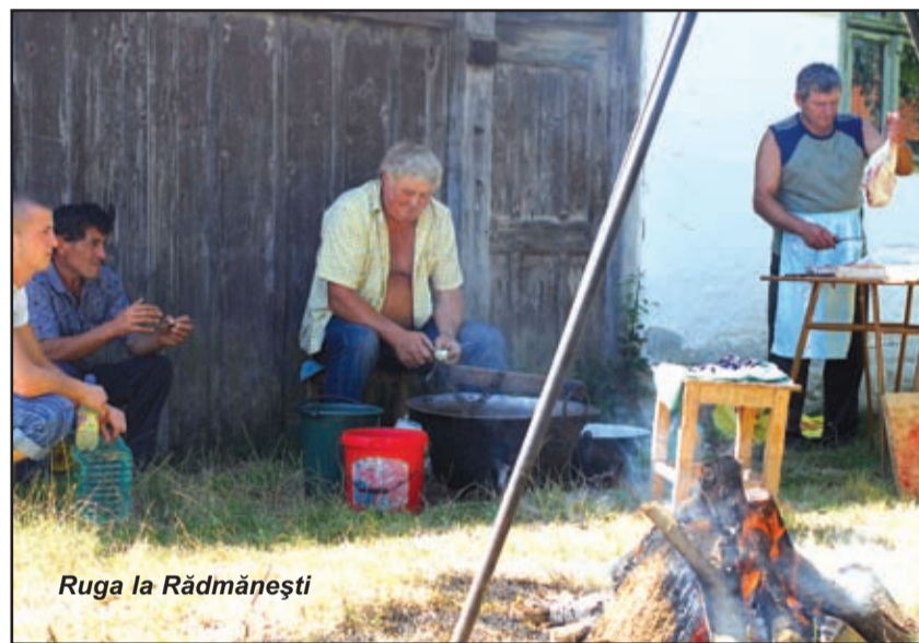
Ruga la Rădmănești