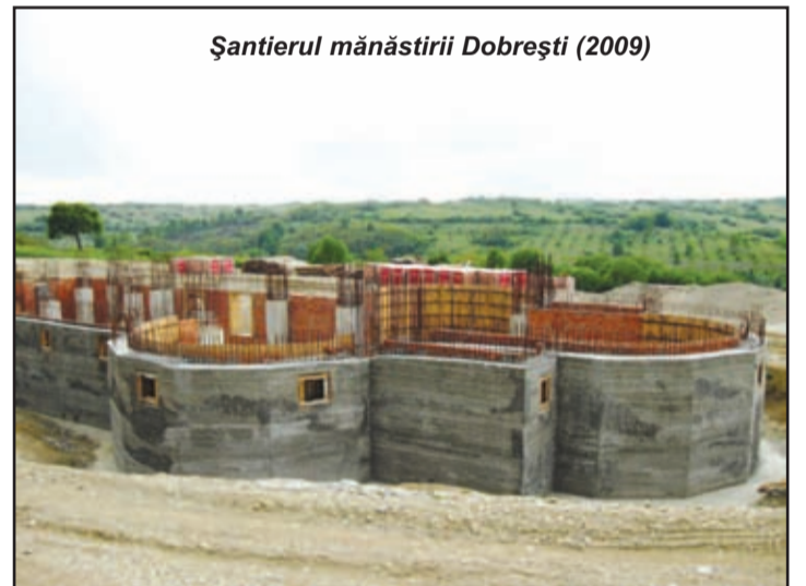
Șantierul mănăstirii Dobrești (2009)

Primăria Bara nu are nici un fel de asociație cu nimeni pentru promovarea localității, deoarece ar fi niște bani dați în plus și nu s-ar rezolva nimic. “Eu m-am gândit la parteneriate, pe turism, pentru mănăstire, iar la