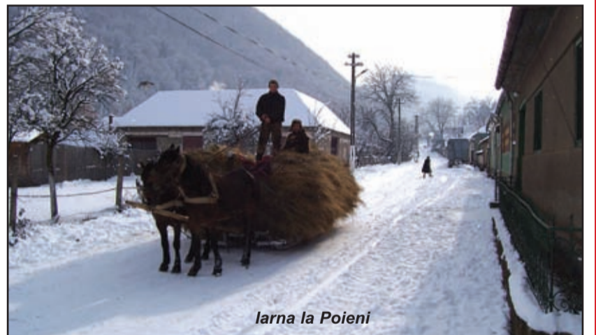
Iarna la Poieni

Pentru anul 2009, administrația din Pietroasa și-a propus să realizeze în folosul comunității mai multe obiective: Modernizarea drumului județean DJ 684/B Pietroasa-Poieni; Finalizarea lucrărilor de