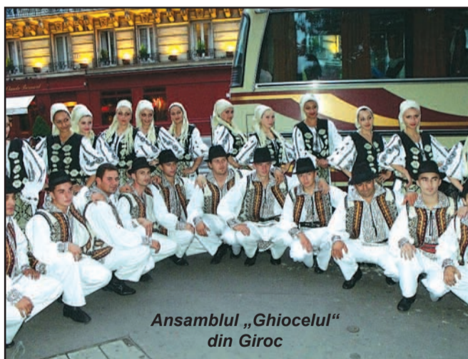
Ansamblul „Ghiocelul” din Giroc