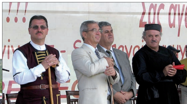
Foto: Deputatul Constantin Canacheu în costum tradițional armănesc (primul din stânga). Steriu Samara, președintele Comunității Armânilor din România, al treilea din stânga,

protejarea și afirmarea sistemului de valori și a identității etnice, culturale, lingvistice și religioase a Armânilor; Consiliul Armânilor solicită recunoașterea Armânilor ca popor regional și autohton în Balcani; Consiliul Armânilor solicită tuturor statelor din Balcani unde trăiesc Armânii să adopte o hotărâre în acord cu normele europene și internaționale care asigure drepturile ce li se cuvin Armânilor ca