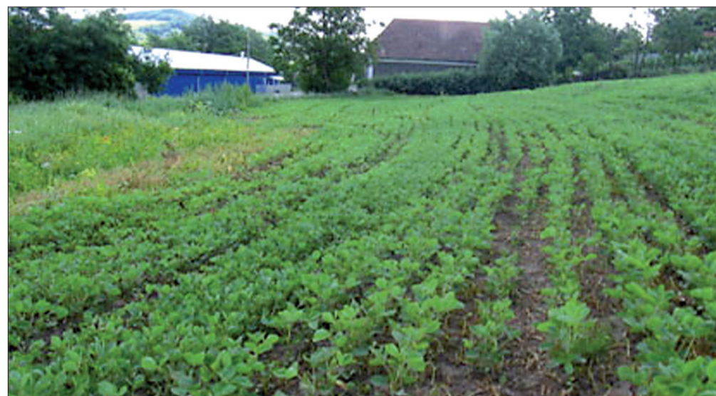
Cultură de soia modificată genetic

Culturile de soia modificate genetic au fost interzise de la 1 ianuarie 2007, România urmând să se conformeze astfel reglementărilor în vigoare în Uniunea Europeană, a informat Ministerul Agriculturii, Pădurilor și Dezvoltării Rurale (MAPDR). La nivel mondial, soia modificată genetic ocupă 77% din cele 30 milioane de hectare alocate acestei plante la nivel global; La nivel mondial, beneficiile economice ale cultivării soiei transgenice însumează 22 miliarde dolari;