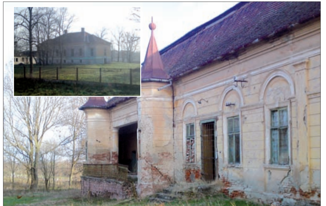
Conacul Petala, iar în medalion Conacul Manase