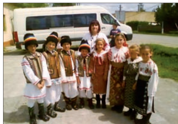
Copii din Stamura Germană participanți la Lada cu zestre 2010