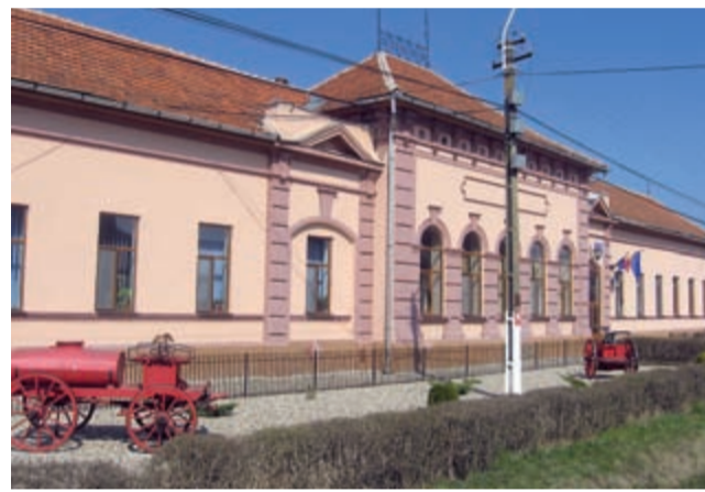
Primăria Jamu Mare

curse, de la Ferendia la Jam și apoi se întoarce în Clopodia. Copiii stau înghesuți. Dacă am putea fi ajutați cu un autobuz, ar fi foarte bine. De la Consiliul Județean avem un microbuz, pe care îl vom înmatricula, are 8 plus 1 locuri, cu care aducem elevii de la Gherman și Lățunaș. Ar fi bine să avem un autobuz, așa copiii trebuie să se scoale de dimineață, apoi trebuie să stea prin Jamu Mare, la plecare. Autobuzul era vechi, din 1985, o dată l-am reparat, dar s-a stricat motorul, blocul motor și altele, a mai funcționat din mai până în noiembrie anul trecut. Nu ne-am risca să luăm un autobuz la