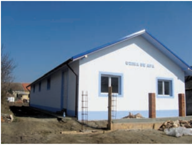
Uzina de apă Jamu Mare

În comuna Jamu Mare, nu sunt, acum, bani pentru continuarea lucrărilor la rețeaua de alimentare cu apă. Dar administrația din localitate nu vrea să lase lucrurile așa, neterminate, cu lu-