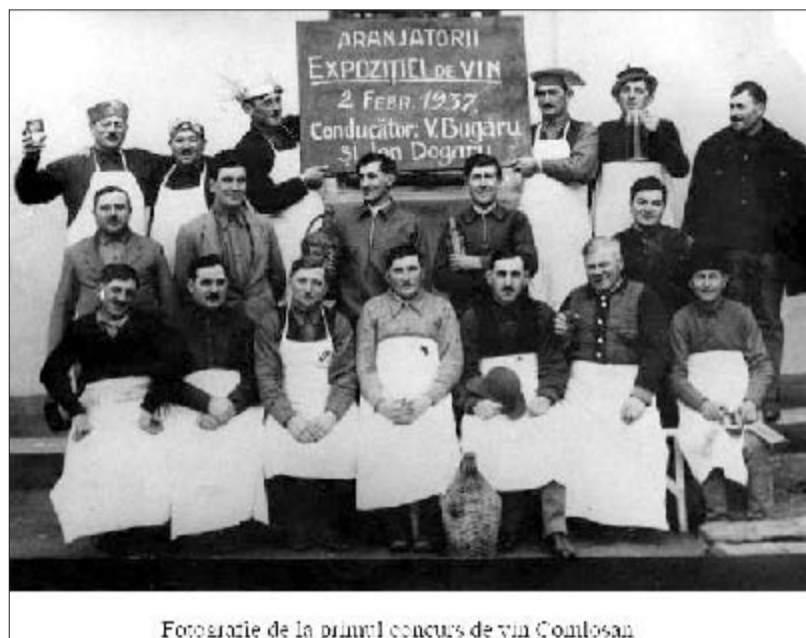
Fotografie de la primul concurs de vin Comloșean

ție în școală nouă. Între timp, cu ajutorul Ministerului am reușit să cumpărăm școlile, în 2009. Investiția nouă fiind pe fonduri externe, nu am mai oprit-o. Școala cu clasele I-IV se va muta în clădirea nouă de la începutul anului școlar”, a explicat primarul, care a explicat că în imobilul vechi spațiile erau folosite la întreaga capacitate de către elevii din cei opt ani de studiu.