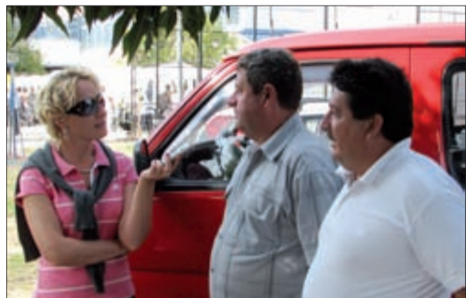
Revista „Cronica” îi interviuează pe reprezentanții comunei Tomești

De sute de ani bănățenii sărbătoresc hramul bisericii, Ruga, la români, Kerwei-ul la șvabi, sărbători care nu lipsesc nici în comunitățile catolice bulgară și maghiară sau în cea a sârbilor ortodocși din Banat. În ultimele decenii au debutat în Banatul istoric alte sărbători populare. La Tomești, în 1973 are loc prima ediție a festivalului de dansuri muzică populară „Nedeia românilor de pretutindeni”. După anul 1989 numărul unor asemenea manifestări culturale crește semnificativ. Buziașul găzduiește „Festivalul Fanfarelor”, Recașul „Festivalul Vinului”, Uivarul „Festivalul transfrontalier al gulașului”, Dumbrava Fes-