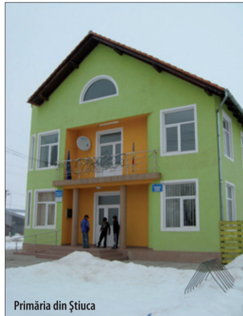
Primăria din Știuca

În 2012, edilul vrea să scoată la licitație pentru realizare sistemul de canalizare în Știuca. Prețul lucrării este de circa un milion de euro. De unde fac rost de acești bani? Primarul ne explică metoda aplicată la rețeaua de apă din Zgribești. „Vom face lucrarea din surse proprii. Am deja o parte din bani, cam 10 miliarde de lei vechi. Nu o să facem un împrumut. La rețeaua de apă din Zgribești, am avut suma de 5 miliarde de lei vechi, iar în caietul de sarcini am precizat că cine îmi face lucrarea și așteaptă după bani doi ani are 30 de puncte. Cine a spus că îmi face lucrarea în trei luni și să le dăm banii în 90 de zile a luat numai 5 puncte. A câștigat cel care a avut curajul să aștepte doi ani. În doi ani m-am achitat de sumă, iar lucrarea care fusese făcută în trei luni. În pri-