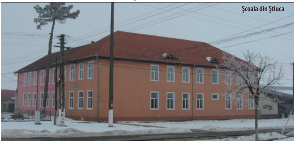
Școala din Știuca